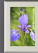
Lila blomma Vet inte vad denna blomma heter, men den växte i trädgården och jag har inte odlat den. Jag tycker den är häftig ☺