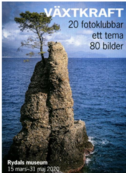
Utställningsaffisch Rydals Museum

coronasäkert i den stora utställningshallen på museet. Utställningen var öppen till 31 maj och därefter fick respektive fotograf sin förstorade utställningsbild.