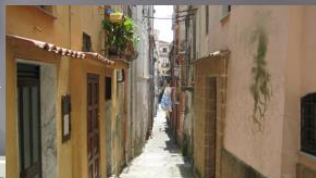
En av många gränder i en by nära Neapel, Italien.