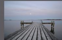
Stilhet Denna bild är tagen tidigt en morgon vid Hovås Kallbadhus, och jag tycker den är rogivande.