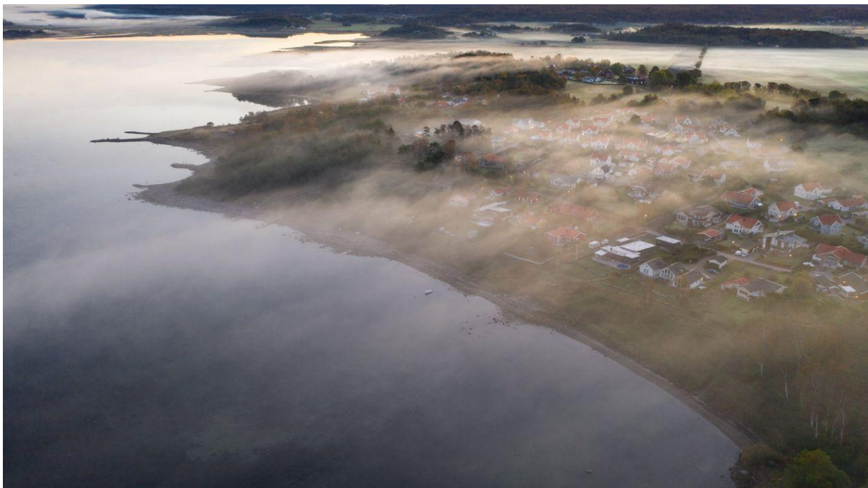
En bild över Åsa tagen med klubbens drönare.

För att täcka försäkringskostnaderna för drönaren tas en avgift om 300 kr ut för en utlåning (max 10 dagar). Drönaren hyrdes ut 11 gånger under året.