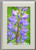
Lupin Vissa ser lupiner som ogräs, men visst kan de vara fina när de blommar.