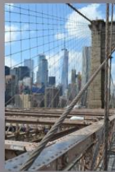
Brooklyn Bridge Detta är en bild från New York och medans jag promenerade över bron, så passade jag på att ta bilder ur olika synvinklar. Detta är ett exempel.