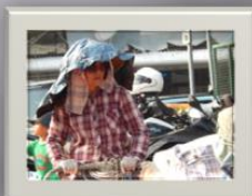
Kvinnan hyrde ut solstolar, parasoller bl.a. på stranden i Stanley, HongKong. Hon vill INTE få sol på sig.