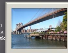
Brooklyn Bridge Park, ett fantastisk område för picknick, jogging, basketboll, utomhusbio och mycket mer.