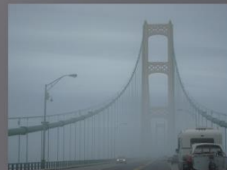
Mackinac Bridge, Michigan, USA. En 8038 m lång hängbro som förbinder Lower Penninsula med Upper Penninsula.