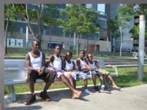
Grabbar (bröder kanske?) som tar en paus i värmen. Detroit River Walk (nära 5 km) där man kan cykla, promenera, fika, spela boll och samtidigt få en fantastisk vy av Windsor, Canada.