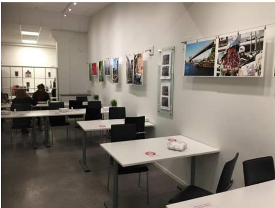
På Dentsply/ Wellspect läggs tidningar (efter cirkulation) i hörnet till vänster om Galleri Vajern.