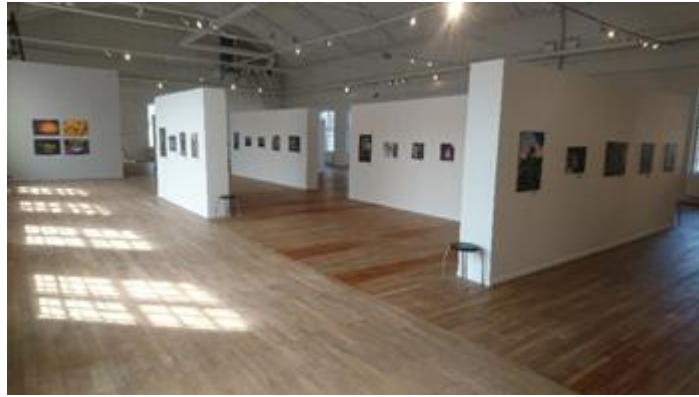
Utställningshallen Rydals Museum

Riksförbundet Svensk Fotografis Riksfotostämma i Avesta blev inställd på grund av corona pandemin, stämman genomfördes istället via ett enkelt pdf-formulär. Tony Clementz och Rune Larsson representerade våra klubbar.