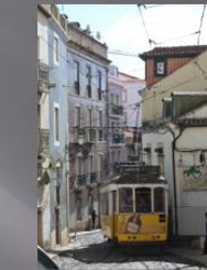
Lissabon Populärt utav turister både att fota och att åka i dessa gamla spårvagnar i Lissabon. Gatorna var våldigt trånga på sina ställen och det var det även att åka spårvagnarna ☺