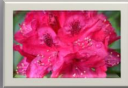
Rhododendron Ville ta en närbild av en rhododendron för jag tycker det är så vacker blomma.